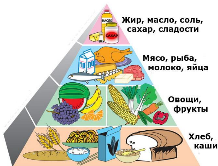
Пирамида здорового питания

К составлению полноценного рациона школьника требуется глубокий подход с учетом специфики детского организма. Освоение школьных программ требует от детей высокой умственной активности. Маленький человек, приобщающийся к знаниям, не только выполняет тяжелый труд, но одновременно и растет, развивается, и для всего этого он должен получать полноценное питание. Напряженная умственная деятельность, непривычная для первоклассников, связана со значительными затратами энергии.